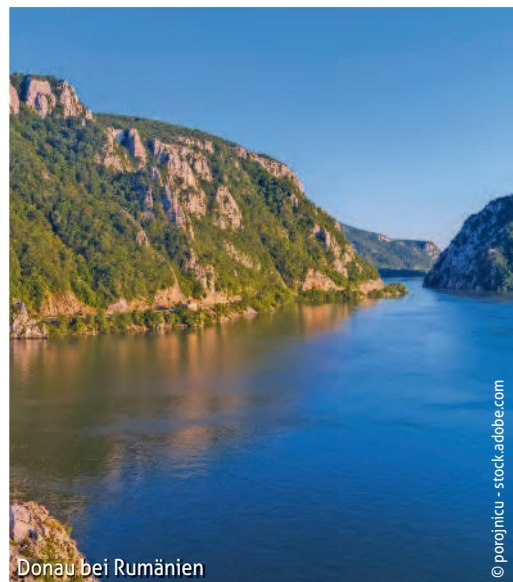
Donau bei Rumänien