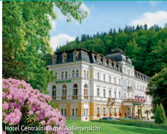
Hotel Centrální Lázně, Außenansicht