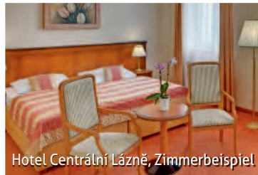
Hotel Centrální Lázně, Zimmerbeispiel