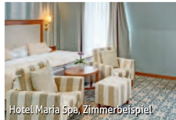
Hotel Maria Spa, Zimmerbeispiel