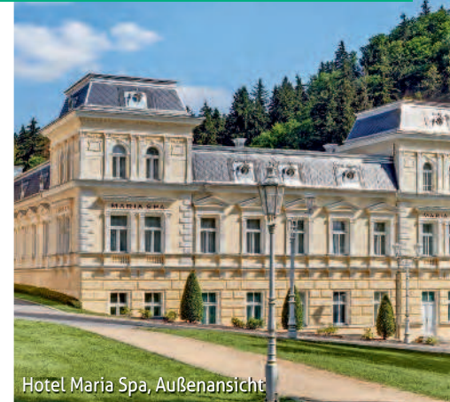
Hotel Maria Spa, Außenansicht