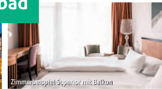
Zimmerbeispiel Superior mit Balkon